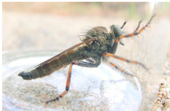
Abb. 11a/b: Habitat und Beleg von T. cowini am Rhein bei Köln-Merkenich