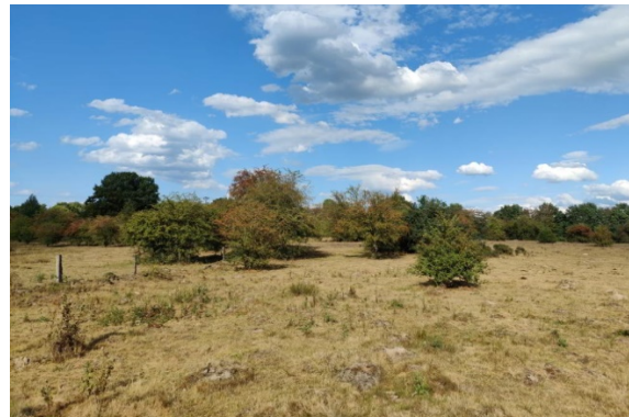
Abb. 2a/b: Hornissen-Raubfliege, eine Charakterart magerer, extensivgenutzter Viehweiden