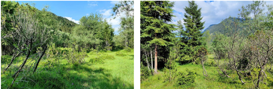
Abb. 6a/b: Habitat von L. vitripennis im Isartal zw. Wallgau und Vorderriß

Der Nachweis vom 6.8.2020 aus dem Kloaschertal ist der jahreszeitlich bisher späteste Beleg dieser Art aus Deutschland.