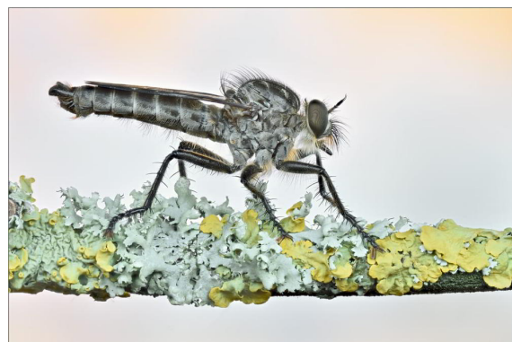
Abb. 7a/b: Habitat und Beleg von M. intermedius bei Gössenheim