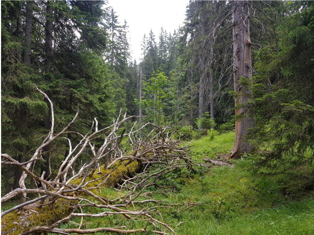
Abb. 8: Habitat von St. aemula am Bernadeinsteig b. Garmisch – naturnaher Fichten-Bergwald