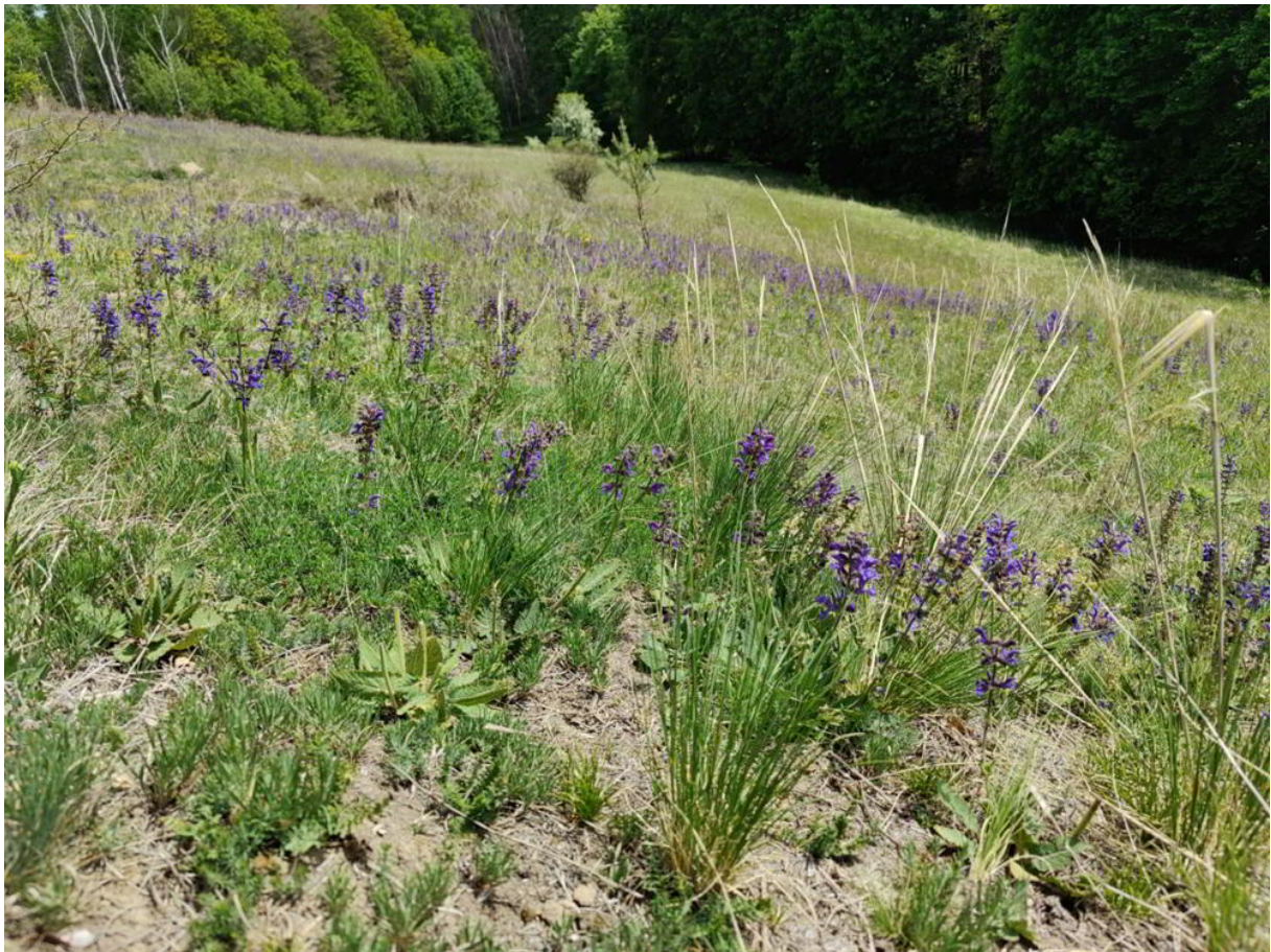
Abb 5: Habitat von Dioctria flavipennis in den Harslebener Bergen – trockenwarme schütterere Steppen- und Halbtrockenrasen

Alle hier aufgeführten Funde stammen aus dem Nordwestdeutschen Tiefland, aus dem die Art bisher nicht bekannt war. Alle Funde stammen aus dem Mai. Möglicherweise liegt die Hauptflugzeit der Art früher als bisher angenommen, was erklären könnte, warum bisher durchgeführte Nachsuchen Ende Juni oder Anfang Juli weitgehend ohne Erfolg geblieben sind.