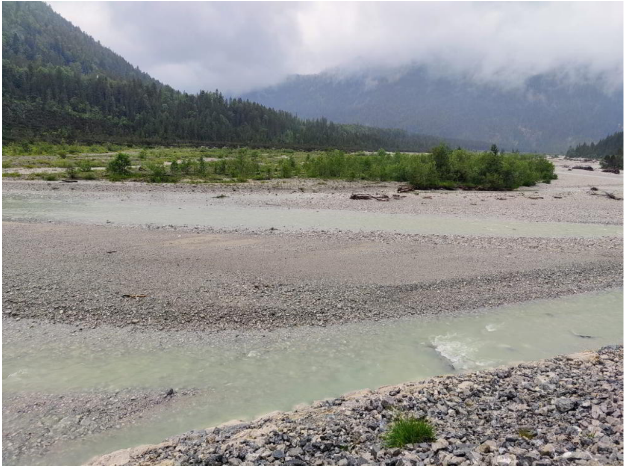
Abb. 12: vegetationsfreie oder spärlich bewachsene Kies- und Schotterbänke im Tal des Rißbaches - Habitat der bisher noch nicht beschriebenen Taxons Lasiopogon spec. A sensu Wolff 2020 bzw. Lasiopogon spec. unc1 sensu Cannings 2002

Die Meldung von Lasiopogon cinctus aus den Kissinger Lechauen ist überwiegend einer noch unbeschriebenen Lasiopogon -Art zuzuordnen ( Lasiopogon spec. A sensu WOLFF 2020 bzw. Lasiopogon spec. unc1 sensu CANNINGS 2002).