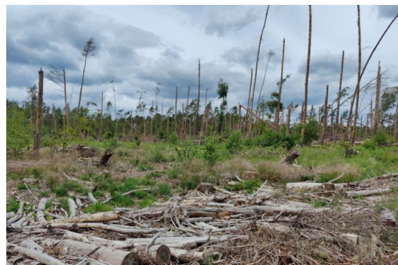
Abb. 3a/b: Ch. gilva -Habitat: Windwurfstelle in Kiefern-Buchenwald mit stehendem Totholz