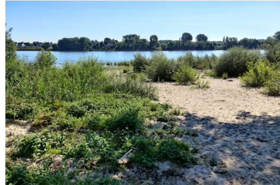
Abb. 10a/b: Habitat von T. cowini am Rhein in Duisburg-Homburg