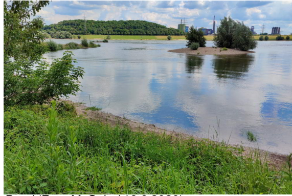
Abb. 9a/b: Habitat von T. cowini am Rhein in Duisburg-Baerl